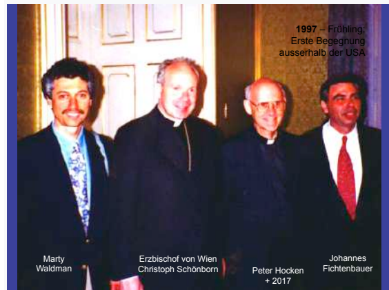
1997 – Vorstellung der TJCII-Vision in Wien

Wie bereits angedeutet, war Pater Hocken überzeugt, dass verschiedene Ereignisse im 20. Jahrhundert nicht je für sich zu sehen waren, sondern als Auswirkungen des e i n e n Wirkens des Heiligen Geistes. Oft bezeichnete er dieses Phänomen als die Vier Überraschungen des Heiligen Geistes: die Ausgiessung des Heiligen Geistes in den Jahren nach 1900 und die daraus folgende Entwicklung der Pfingstbewegung; die später einsetzende charismatische Bewegung in den protestantischen Kirchen; die charismatische Bewegung in der katholischen Kirche ab 1967 und schliesslich die Geburt der modernen messianischen Bewegung, die ebenfalls 1967 geschah, obwohl es sicherlich schon Vorläufer dieser Bewegung im späten 19. und frühen 20. Jahrhundert gab.